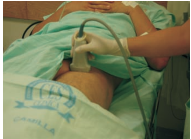
Foto 1. Colocación del paciente y transductor para el bloqueo femoral, con aguja fuera del plano.

ocasionar descargas innecesarias del CDI. Por esta razón se decide, bajo visión ecográfica, llevar a cabo bloqueo de los nervios ciático (abordaje posterior) y femoral (Foto 1). Bajo sedación con midazolam 2 mg venosos y fentanilo 50 mcg venosos, se aplica lidocaína sin epinefrina al 1,5 %, 20 cc, y lidocaína con epinefrina al 1 %, 10 cc, más levobupivacaína al 0,5 %, 10 cc. Se obtuvo bloqueo completo motor y sensitivo del nervio ciático diez minutos después del procedimiento.