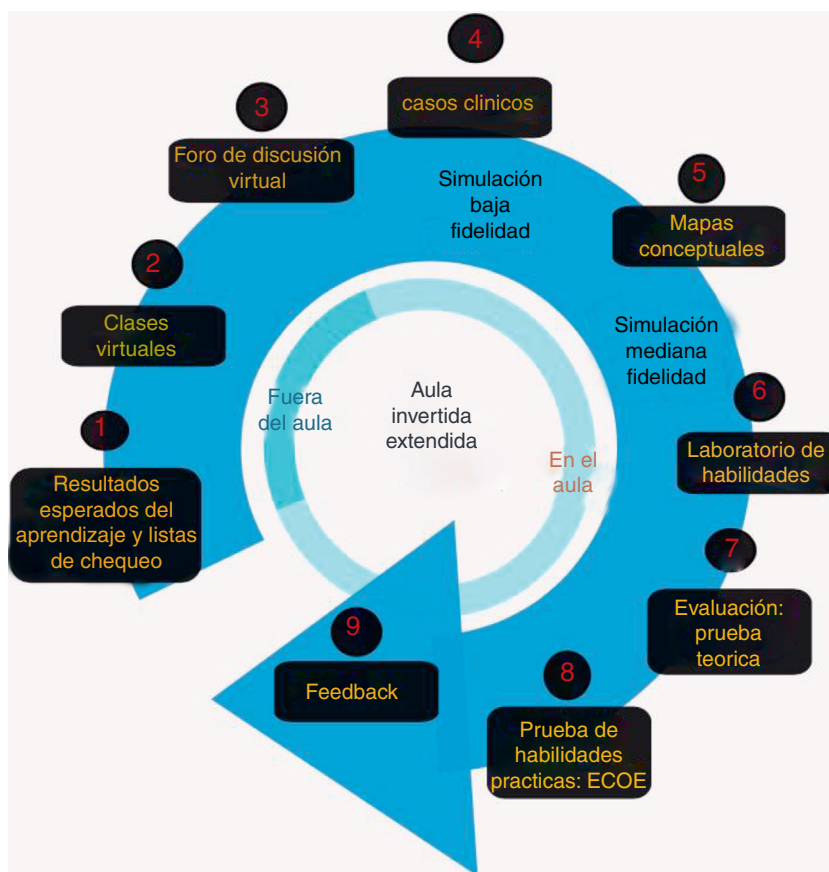
Figura 1 – Modelo del aula invertida extendida a simulación clínica.