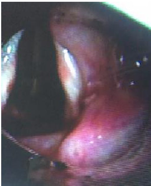
Figura 2 – Estenosis subglótica posterior a dilatación.