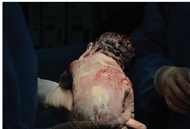
Figura 3. Recién nacido con la columna completamente cicatrizada.

La incidencia exacta de defectos del tubo neural (DTN) en nuestro país es desconocida. Tarqui-Mamani y col.,