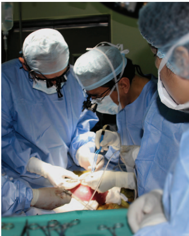
Figura 2. Adecuada relajación uterina que permite la neurorrafia.

Posteriormente, se posicionó a la paciente en decúbito supino y se inició la infusión de remifentanilo a 1.5 ng/ml concentración en sitio efecto (Ce) vía TCI (target control infusion). Previa asepsia y antisepsia, e infiltración de anestésico local, se colocó un catéter arterial en la arteria radial derecha. Previa preoxigenación se procedió a la inducción de secuencia rápida, con 5 ng/ml remifentanilo Ce vía TCI, 4 ug/ml propofol Ce vía TCI y 1 mg/kg de rocuronio, se realizó maniobra de Sellick, lográndose la intubación al primer intento, sin cambios importantes en los parámetros hemodinámicos. Se programó la infusión de remifentanilo y propofol, para alcanzar un Índice Bispectral (BIS) entre 40- 60, y parámetros hemodinámicos con una fluctuación menor al 20% con respecto a los valores iniciales. La infusión de remifentanilo se utilizó a su vez para lograr anestesia fetal por vía transplacentaria. Se inició la cirugía sin interrecurrencias, y al momento de la exposición uterina para acceder al feto se utilizó una infusión de nitroglicerina que varió desde 1 ug/kg/min hasta un máximo de 6 ug/kg/min para favorecer la relajación uterina y permitir la neurorrafia por parte del neurocirujano, como se puede apreciar en la Figura 2 . Se infundió etilefrina a dosis de 2.5-5 ug/kg/min para mantener una PA sistólica > 90 mmHg y una PA media > 60 mmHg, y la infusión de cristaloides fue de 20 ml/hora. Al término de la