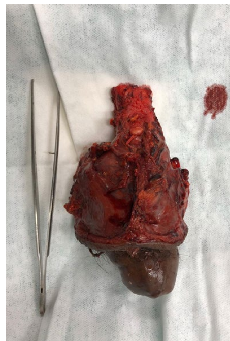
FIGURA 4. Pieza quirúrgica de cáncer de pene, originado en el surco balanoprepucial, infiltrando la fascia, túnica albugínea y dartos, los cuerpos cavernosos y el tejido esponjoso periuretral.