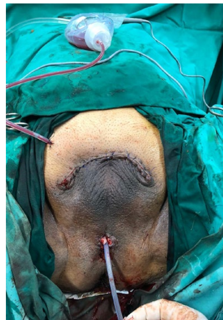
FIGURA 3. Herida quirúrgica postoperatoria de penectomía radical con uretostomía perineal y drenaje quirúrgico Jackson Pratt.

perineal (Figuras 2, 3 y 4). Recibió ácido tranexámico, efedrina 6 mg, sulfato magnesio 1,25 gr y paracetamol 1 gr, además de la antibioticoterapia según horario. Sufrió una pérdida de sangre de 700 cm 3 , aproximadamente, por lo que se le transfundieron 2 unidades de glóbulos rojos. El tiempo quirúrgico fue de 115 minutos. Cursó el postoperatorio en unidad de cuidados intermedios, con signos al ingreso de PA 114/74, FC 67 y SatO 2 98 % ambiental, afebril y EVA 0. Los días siguientes evolucionó estable, con dolor EVA 1 en reposo y 2 dinámico—promedio durante las primeras 96 hr—, el cual se trató con analgesia controlada por el paciente (PCA) vía peridural, con levobupivacaína 0,125 % en programación inicial de 5 (infusión mL/hr), 5 (bolo en mL requerido por el paciente) y 20 (bloqueo 20 min). Además, se mantuvo con paracetamol, pregabalina y citalopram. El registro de EVA e infusión peridural se detallan en la Figura 5. Debido a sus altos requerimientos diarios (demanda de 35 bolos diarios promedio y administrados 25), se mantuvo el catéter peridural por siete días, con una buena