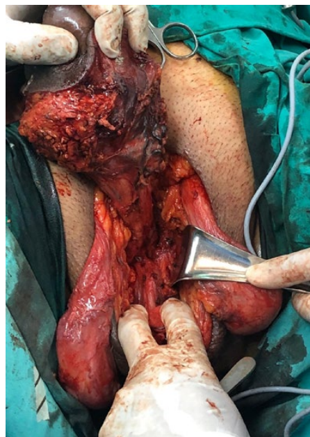
FIGURA 2. Penectomía radical, seccionando los cuerpos cavernosos.

Luego, en posición de litotomía modificada, se realizó la PR (seccionando ambos cuerpos cavernosos) y se dejó uretostomía